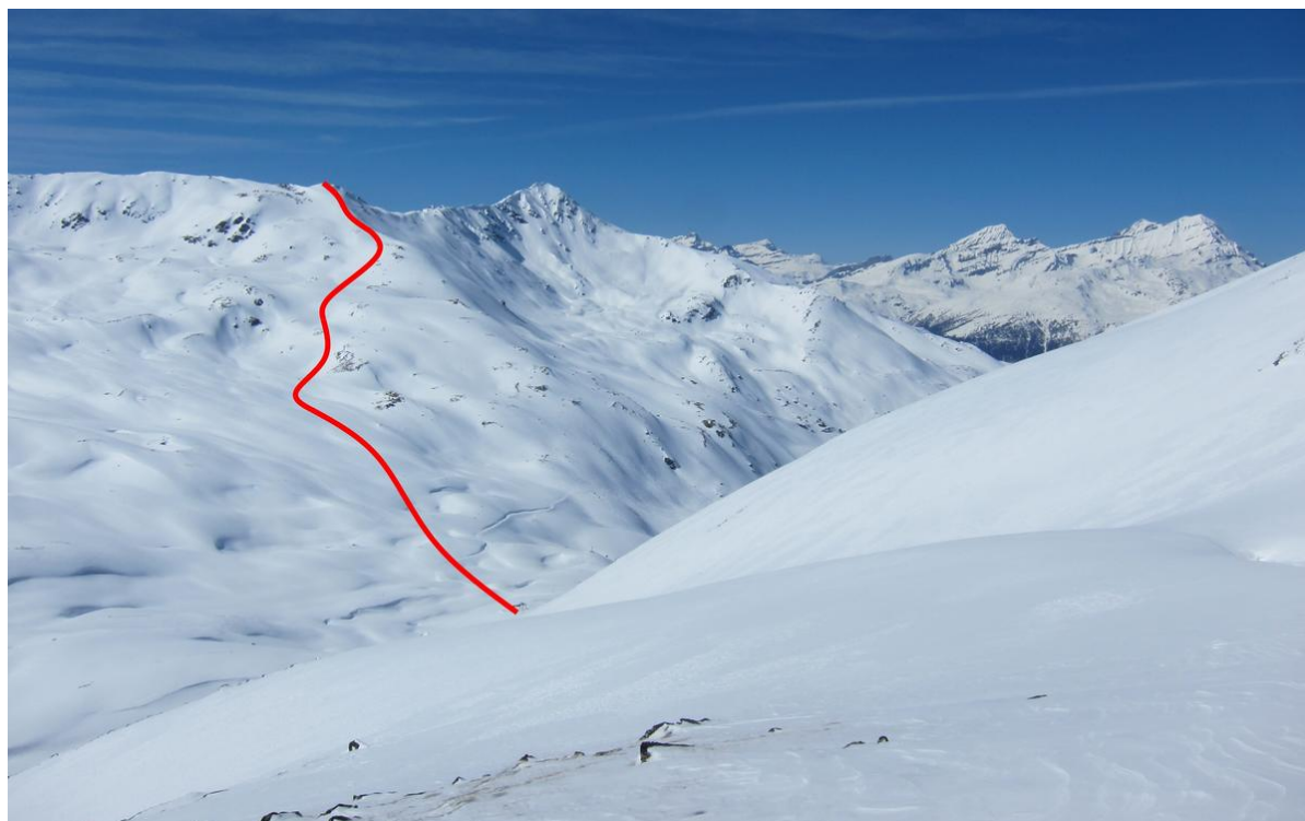
Altstafelhorn: Von der Bergstation des Skilifts Unners Sänntum–Seefeld zum Gipfel, Georges Sanga